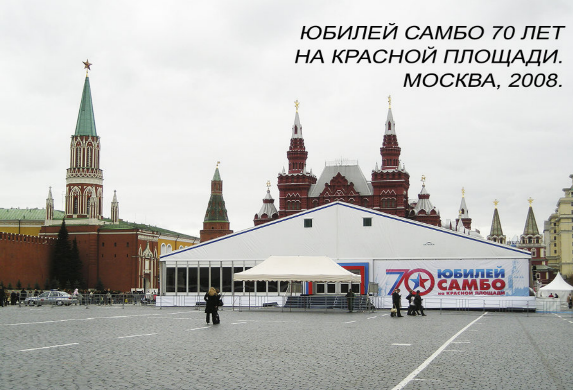
ЮБИЛЕЙ САМБО 70 ЛЕТ НА КРАСНОЙ ПЛОЩАДИ. МОСКВА, 2008г.