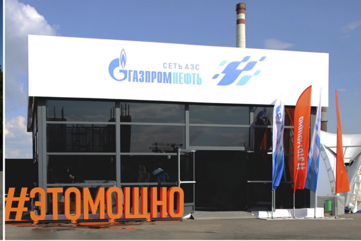
ЧЕМПИОНАТ МИРА ПО ХОККЕЮ. МОСКВА, 2016г.