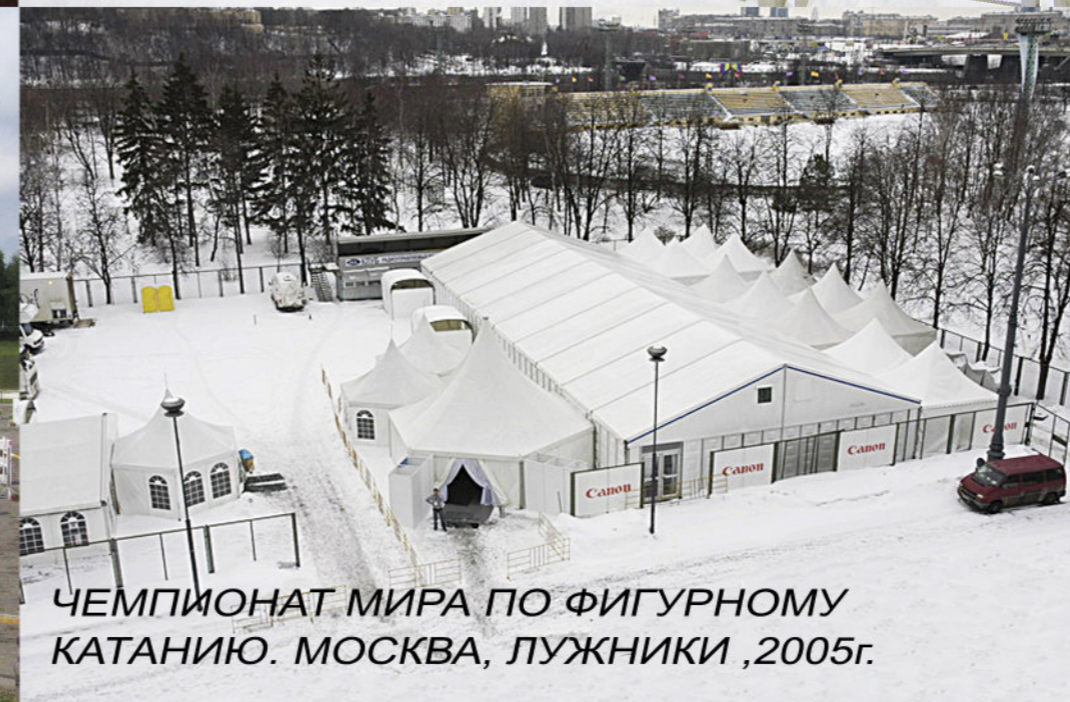
ЧЕМПИОНАТ МИРА ПО ФИГУРНОМУ КАТАНИЮ. МОСКВА, ЛУЖНИКИ, 2005г.