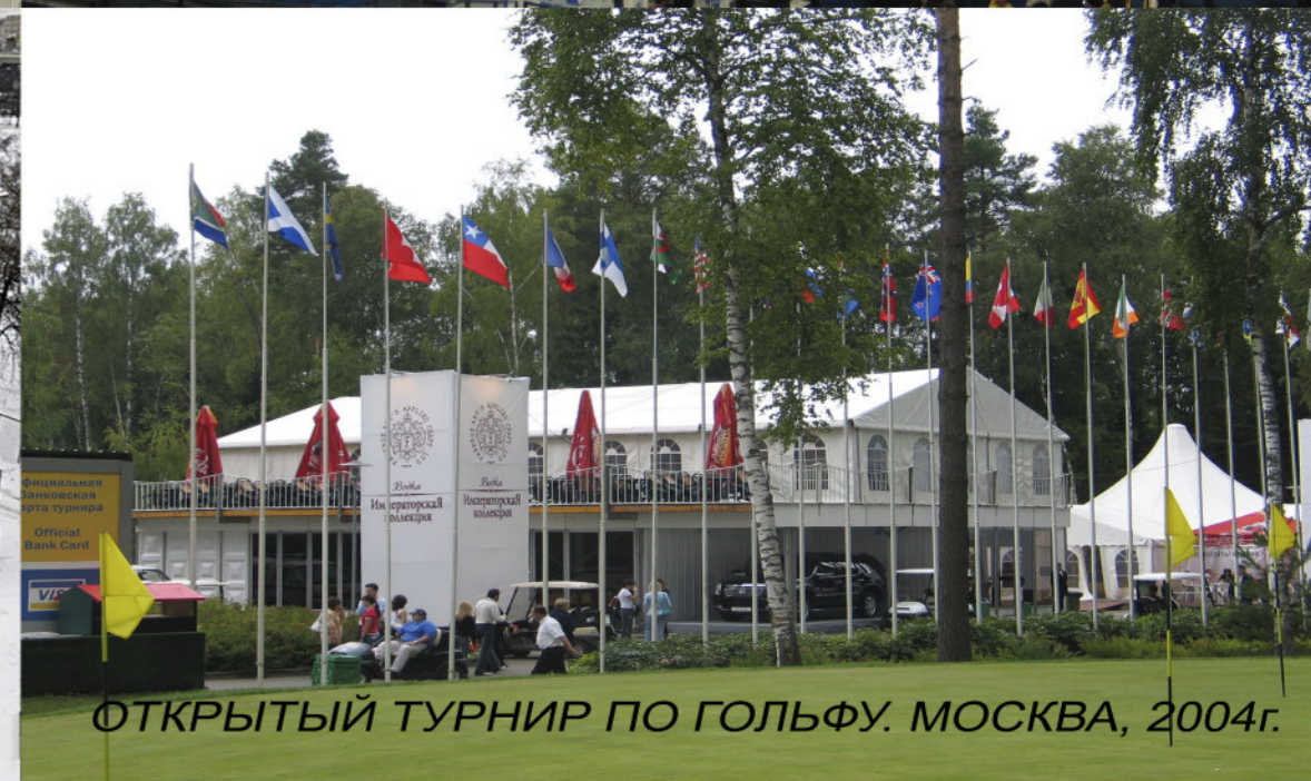
ОТКРЫТЫЙ ТУРНИР ПО ГОЛЬФУ. МОСКВА, 2004г.