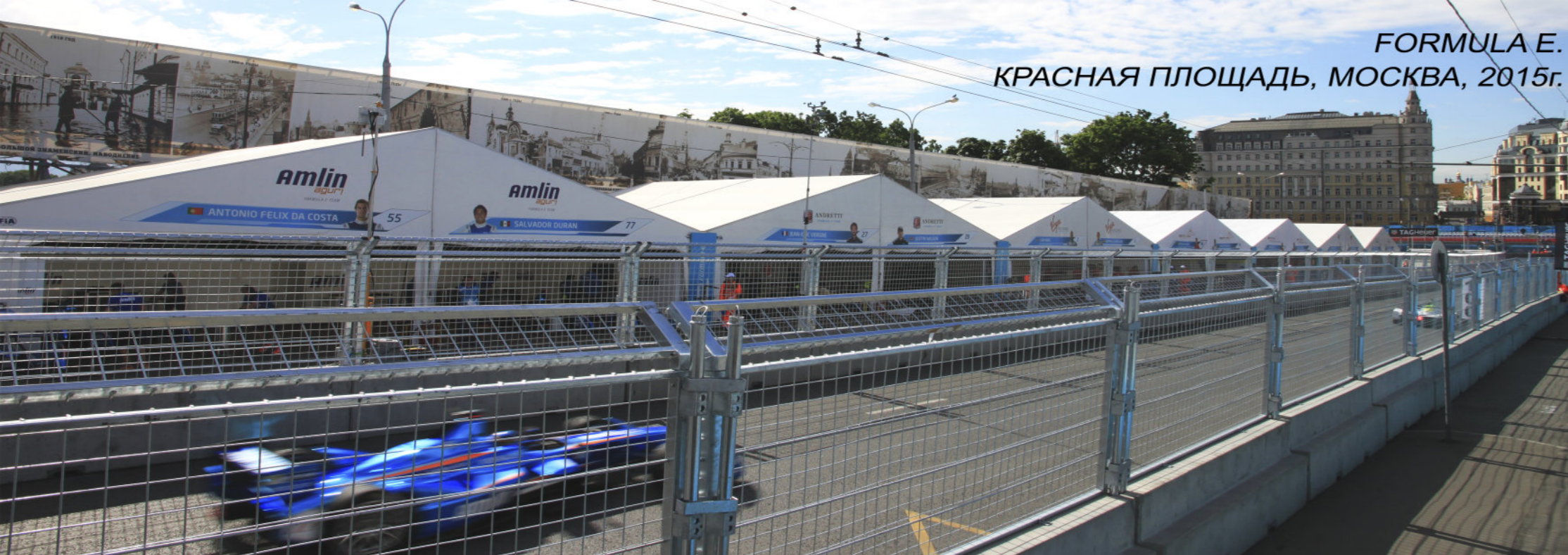
FORMULA E. КРАСНАЯ ПЛОЩАДЬ, МОСКВА, 2015г.