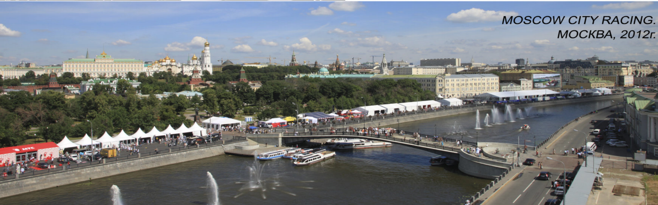
MOSCOW CITY RACING. МОСКВА, 2012г.