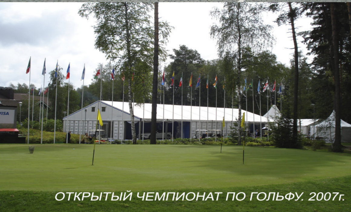
ОТКРЫТЫЙ ЧЕМПИОНАТ ПО ГОЛЬФУ. 2007г.