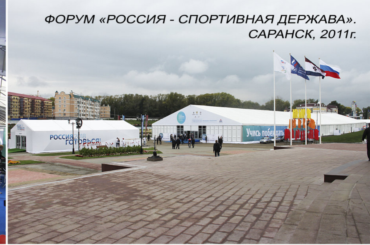
ФОРУМ «РОССИЯ - СПОРТИВНАЯ ДЕРЖАВА». САРАНСК, 2011г.