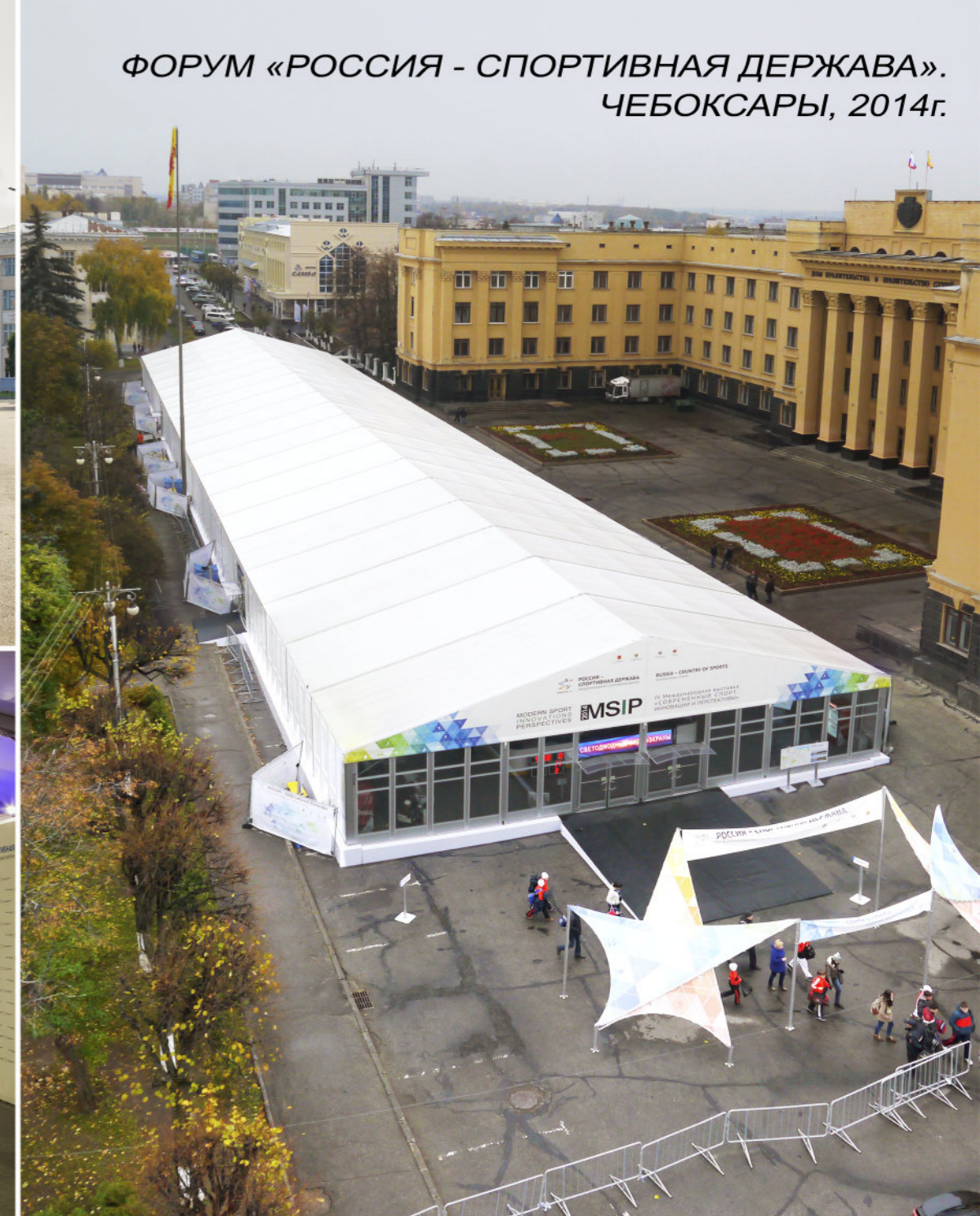
ФОРУМ «РОССИЯ - СПОРТИВНАЯ ДЕРЖАВА». ЧЕБОКСАРЫ, 2014г.