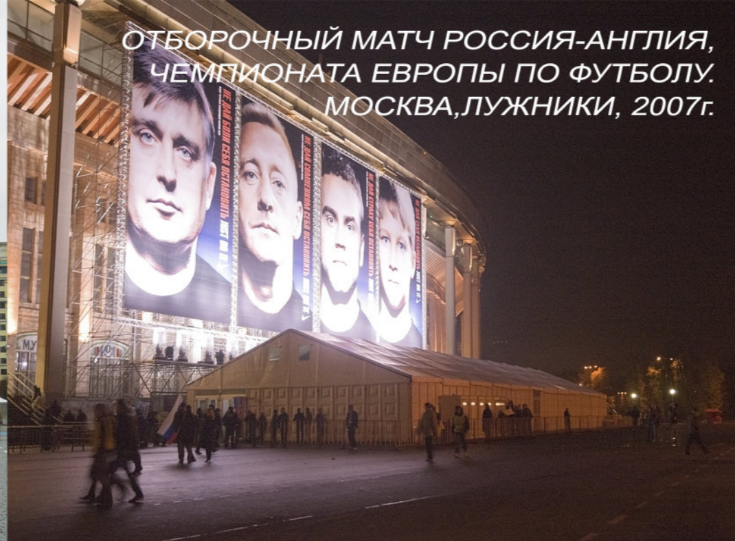
ОТБОРОЧНЫЙ МАТЧ РОССИЯ-АНГЛИЯ, ЧЕМПИОНАТА ЕВРОПЫ ПО ФУТБОЛУ. МОСКВА, ЛУЖНИКИ, 2007г.