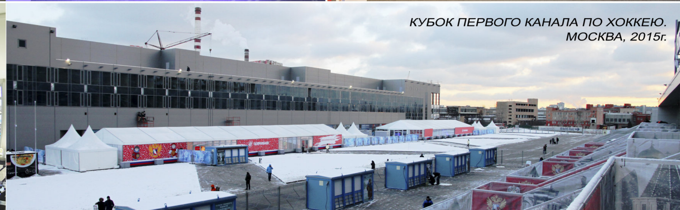
КУБОК ПЕРВОГО КАНАЛА ПО ХОККЕЮ. МОСКВА, 2015г.