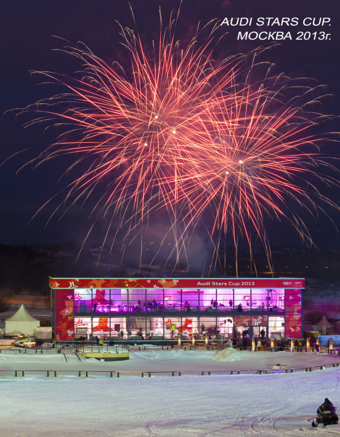
AUDI STARS CUP. МОСКВА 2013г.