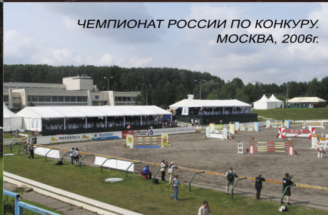
ЧЕМПИОНАТ РОССИИ ПО КОНКУРУ. МОСКВА, 2006г.