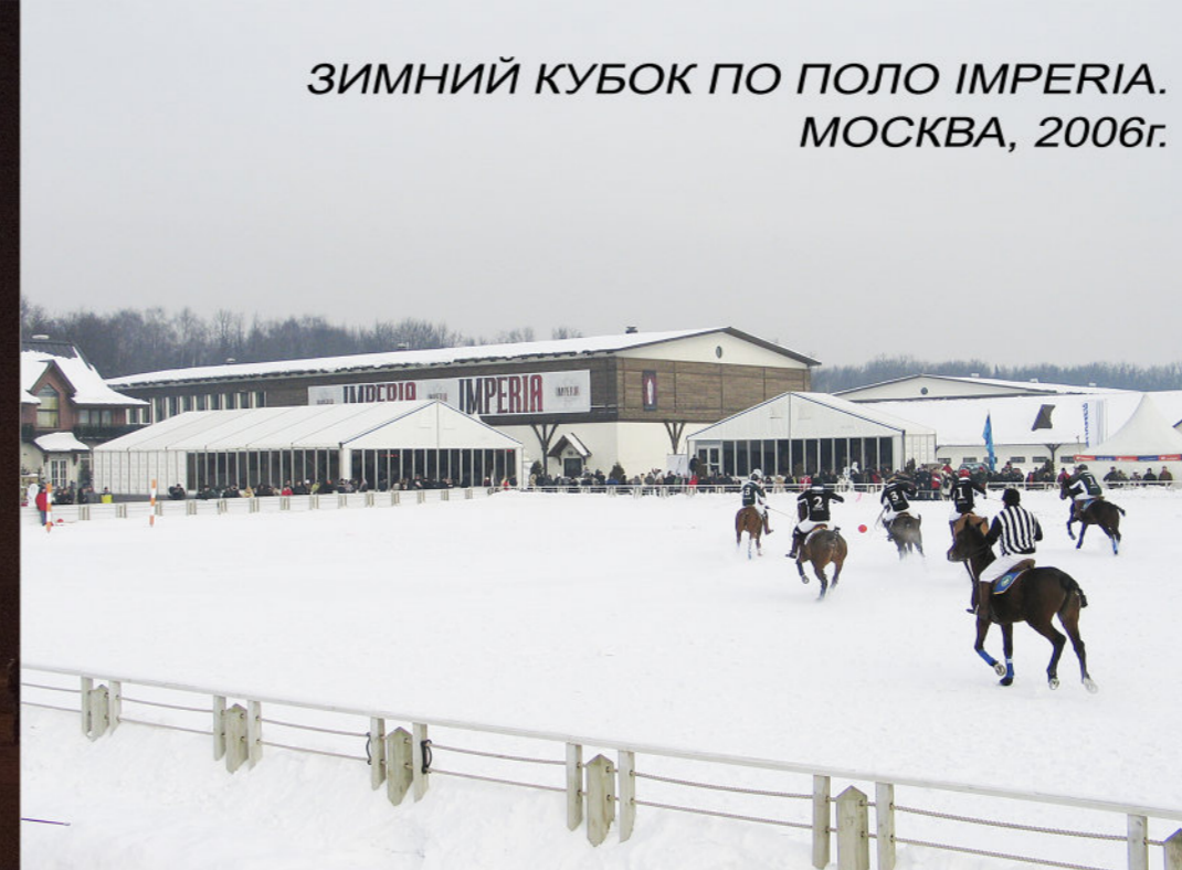
ЗИМНИЙ КУБОК ПО ПОЛО IMPERIA. МОСКВА, 2006г.