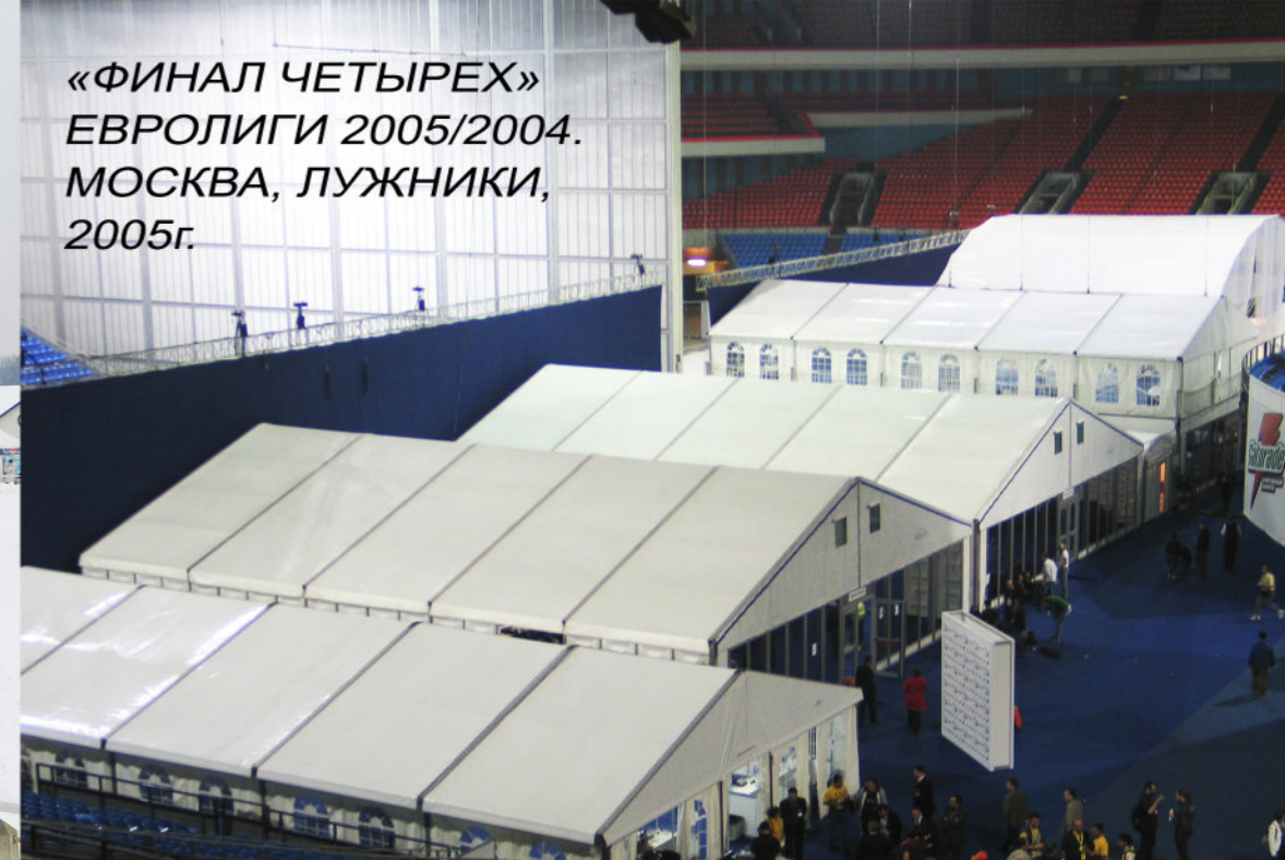
«ФИНАЛ ЧЕТЫРЕХ» ЕВРОЛИГИ 2005/2004. МОСКВА, ЛУЖНИКИ, 2005г.